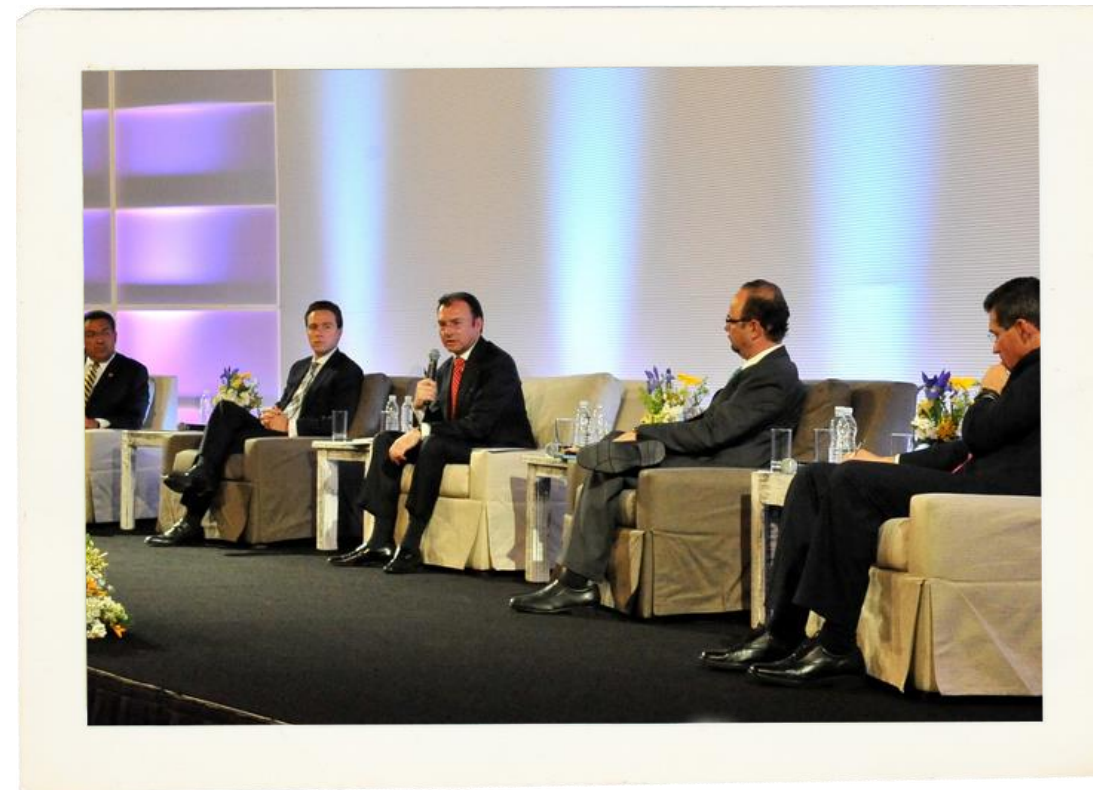
Reportagem Palestra Entrevistas