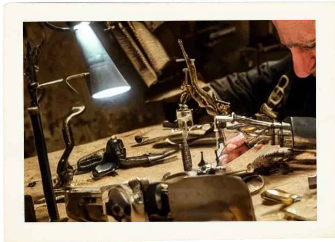
Whorkshop / Ateliê