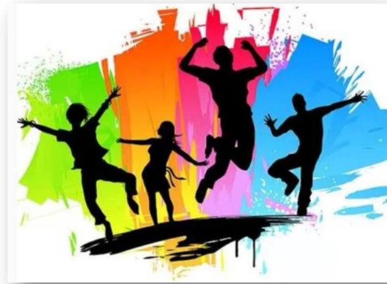
A Dança e a Música