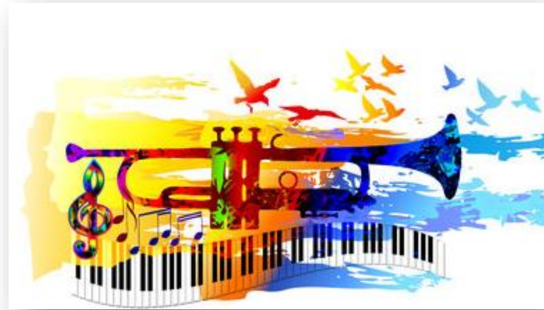
Artes Plásticas e a Música