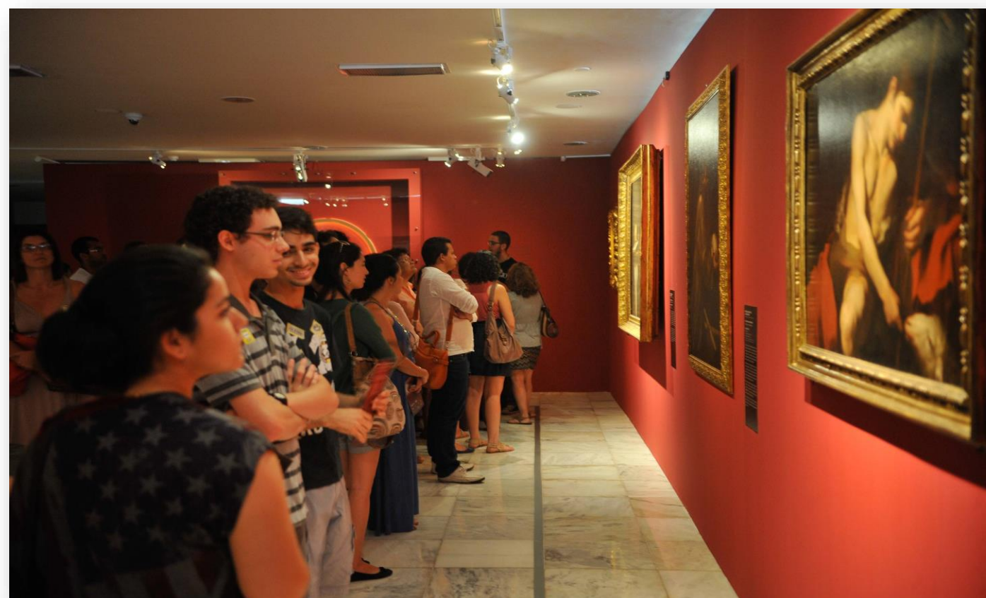
Pintura - Escultura