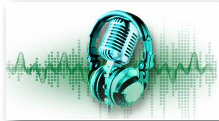
A Rádio e a Música