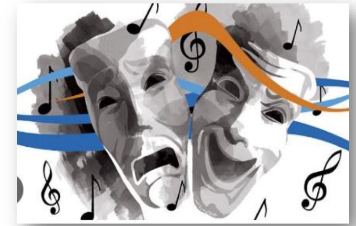
Teatro / Cinema / Fotografia

Música e as outras artes representam disciplinas relacionadas que são capazes de revelar sentimentos e experiências humanas, tanto no seu lado positivo e alegre como no seu lado mais introspetivo e sério.